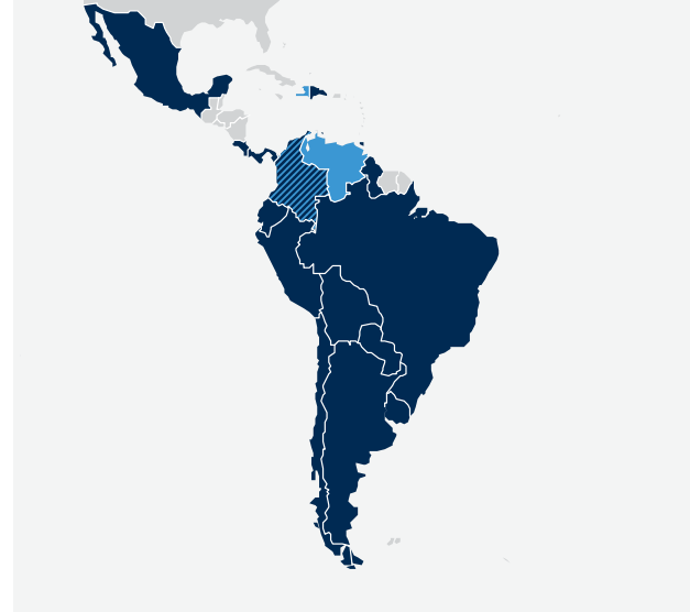
بلدان خطط الاستجابة الإنسانية HRPS البلدان المدرجة في خطة الاستجابة للاجئين والمهاجرين من فنزويلا (RMRP).

في هايتي، زادت الاحتياجات الإنسانية - التي بلغت مستوى قياسياً بالفعل قبل الوباء - بشكل أكبر. تهدد جائحة كوفيد - 19 بشل نظام الرعاية الصحية الرث في البلاد وتعرض الإنجازات في إنهاء تفشي الكوليرا للخطر. وقد زاد عدد المحتاجين إلى 5.1 مليون شخص. يحتاج حوالي 4.1 مليون شخص إلى مساعدة غذائية عاجلة، ومن بين هؤلاء 1.2 مليون شخص يواجهون مستويات طارئة من انعدام الأمن الغذائي. معدلات سوء التغذية الحاد تتجاوز بالفعل معيار مستوى الطوارئ لمنظمة الصحة العالمية 2.1 في المائة، ومن المتوقع أن يزيد الوباء عدد الأطفال الذين يعانون من سوء التغذية دون سن الخامسة بنسبة 25 بالمائة. من المتوقع أن تزداد نسبة سكان هايتي مع الوصول المحدود أو المنعدم إلى المياه الصالحة للشرب من 35 إلى 60 في المائة، أو 6.8 مليون شخص. تتطلب خطة الاستجابة الإنسانية المنقحة لعام 2020 مبلغ 471 مليون دولار للاستجابة لاحتياجات 2.3 مليون شخص. بما في ذلك الاستجابة ذات الصلة بكوفيد - 19. إن نسبة تمويل خطة الاستجابة الإنسانية هي فقط تسعة في المائة، مما يحد بشدة من قدرة المنظمات الإنسانية على تقديم المساعدة.